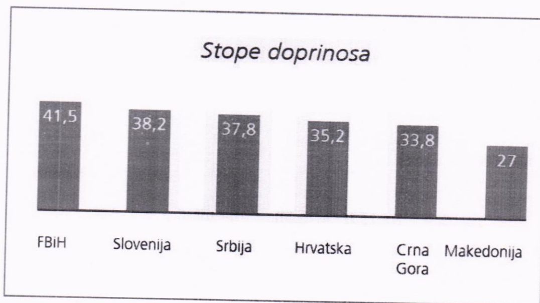
Slika 1.2. Stopa doprinosa u FBiH

Uvođenje novih poreza ili izmjena postojećih: Na primjer, reforma poreza na dohodak i dobit, povećanje ili smanjenje poreza na dodatu vrijednost (PDV) - na nivou države, ili uvođenje